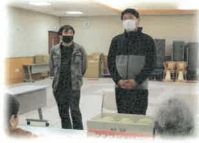
クラウンメロン支所様