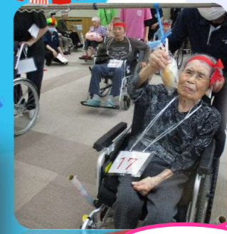
盛り上がってきました！

日頃は、遠州の園の運営につきましてご協力を賜り、誠にありがとうございます。 10月16日『遠州の園 大運動会！』を開催しました。大地へ大集合！【ラジオ体操】【パン食い競争】【玉入れ】、紅VS白、紅白に分かれて対決！声を出し、歓声をあげながら楽しみました。職員対抗綱引きでは、職員同士の真剣な表情がみられました。みんなでワイワイ、笑いあいの運動会、入居者様と職員と一緒に盛り上がり、楽しいひとときでした。