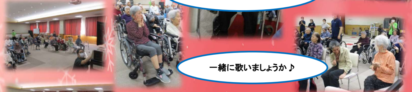
一緒に歌いましょうか♪