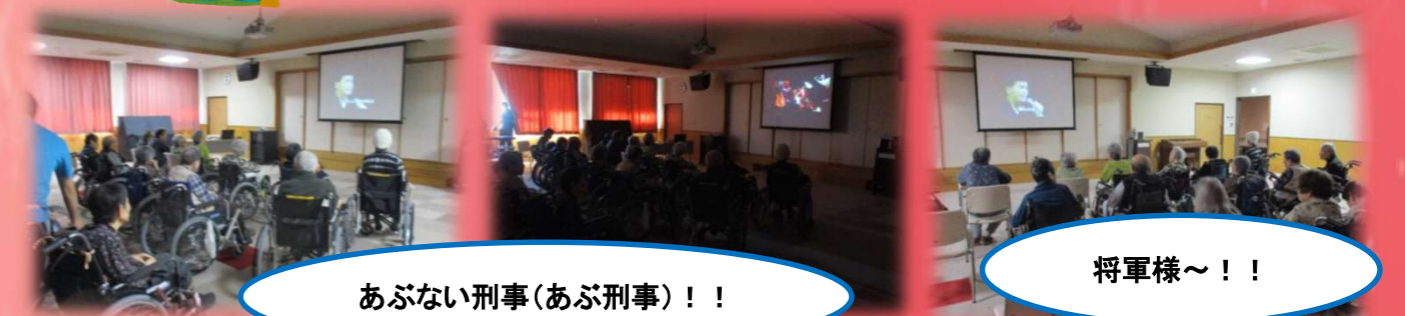
あぶない刑事(あぶ刑事)！！