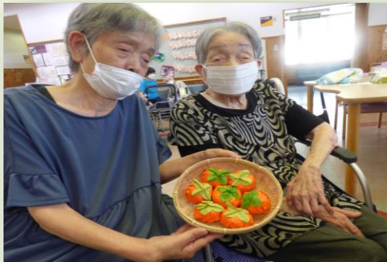
本物みたい! 美味しそうな柿が出来ました☆彡