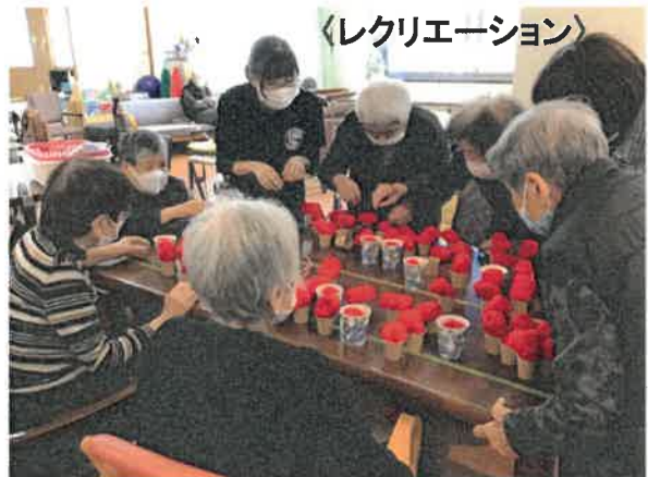
〈レクリエーション〉