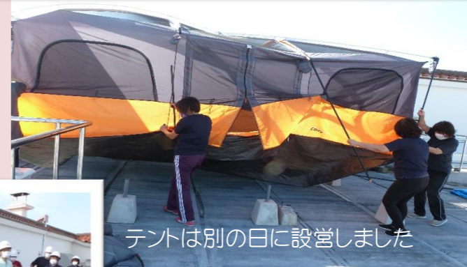
テントは別の日に設営しました

津波想定で避難訓練を行いました。屋上へ避難をし、テントの設置を想定しました。地震はいつ来るかわかりませんが、きてほしくないですね。