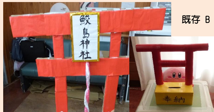
既存 B 棟